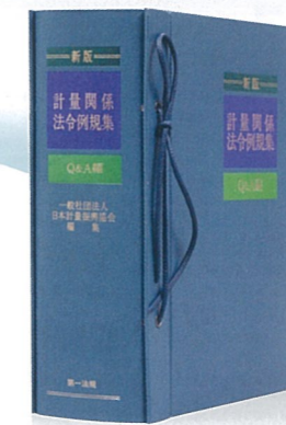
新版 計量関係法令例規集—Q&A編—