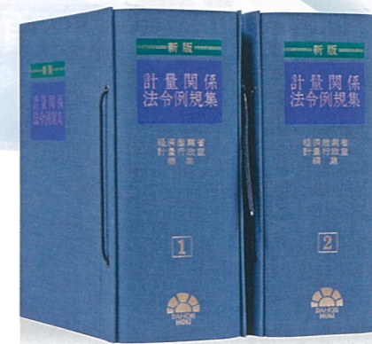
新版 計量関係法令例規集